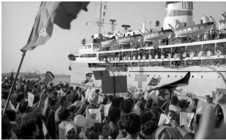
1961年5月19日に出港した第59次船。

なお、朝鮮戦争で失われた労働力の量的な確保が北朝鮮の主目的であったという説があるが、それをはっきり示す文献は見当たらない。ただ、不足する技術者と企業家の帰国誘致策を打ち出し厚遇したとの記録が残っている。 *5 本書でも、生産現場を指導できる幹部、技術者が不足していたため、帰国した在日の技術者が重宝されたという旨の証言を紹介している。金日成 キムイルソン 政権は、在日朝鮮人の帰国と時を近くして中国の